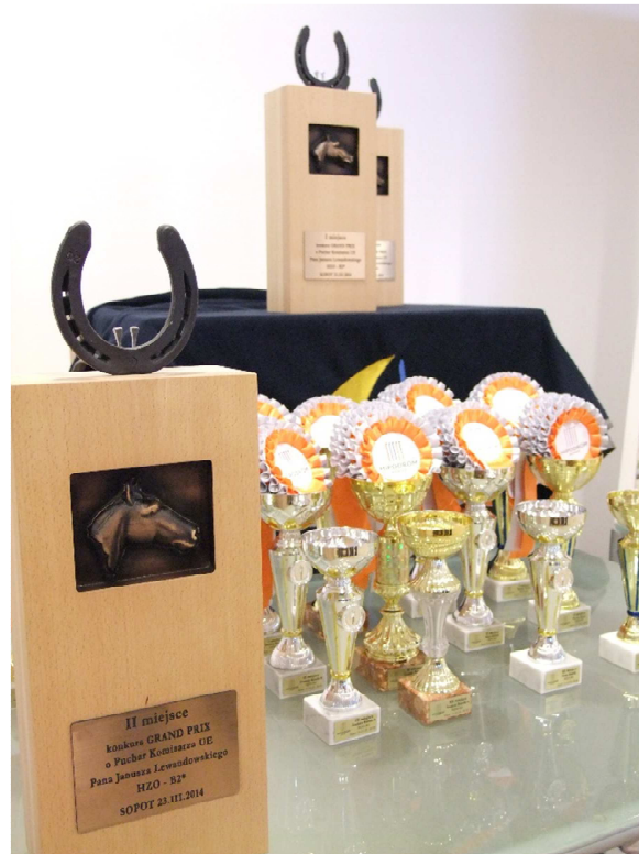
Nadruk nazwy partnera na tabliczce pucharu