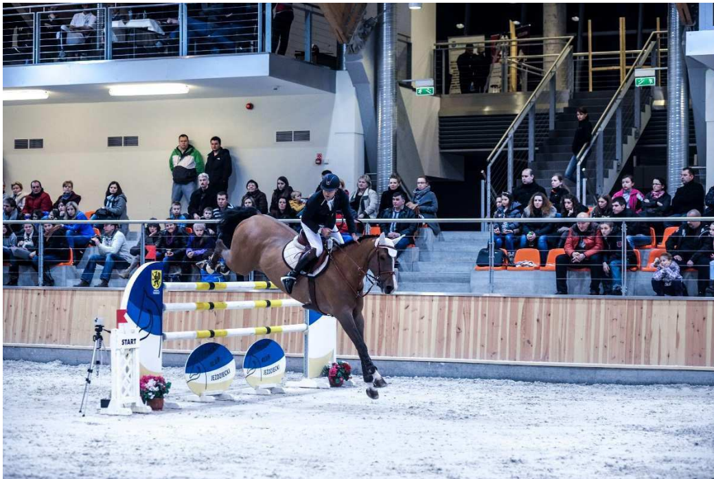
Przykład przeszkody partnera