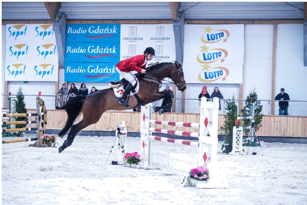
Przykład umieszczenia plansz sponsorskich