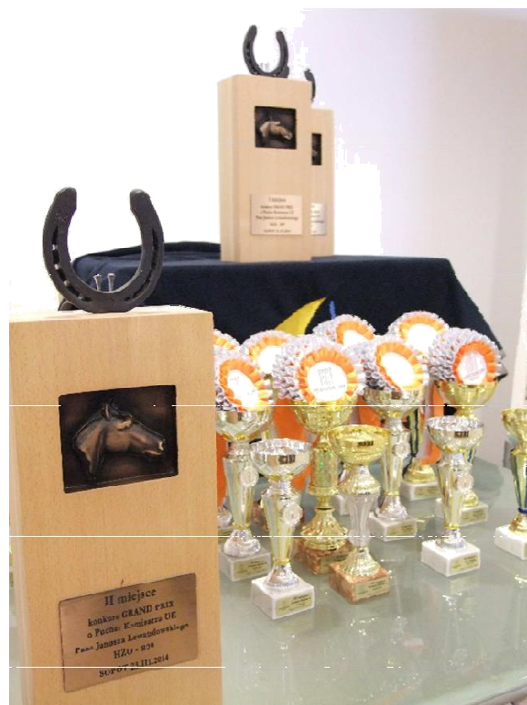
Nadruk nazwy partnera na tabliczkach nagród w konkursach